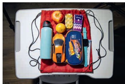
Tasje voor als kinderen moeten schuilen in de schoolbunker tijdens luchtalarm.