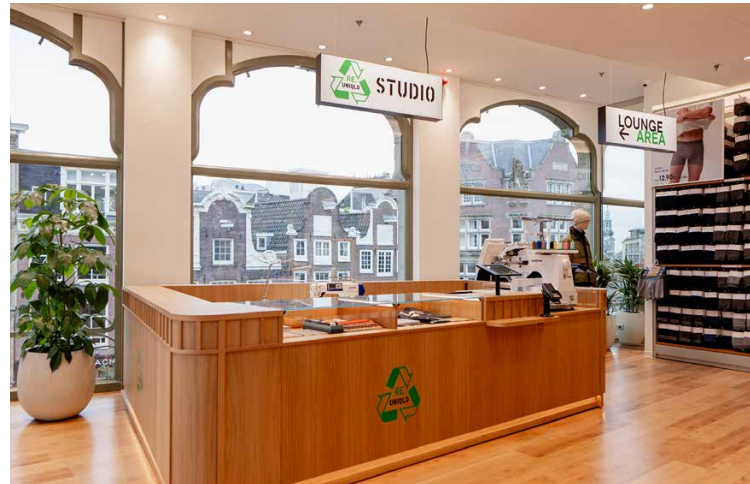
Onder: Re.UNIQLQ Reparatiestudio in Amsterdam

WE GEVEN 50 EXCLUSIEVE PEACE FOR ALL X CLUB FOR THE FUTURE T-SHIRTS WEG