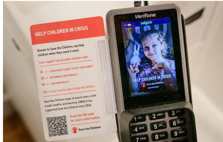
Terminal met fondsenwervingscampagne

We zijn afgelopen maand begonnen met de Heart of LifeWear-campagne, waarbij we duizenden HEAT-TECH-items uitdelen aan kwetsbare groepen om de winter door te komen, wereldwijd en in Nederland. Onze eigen medewerkers geven deze persoonlijk aan mensen die vaak buiten slapen, zodat ze warmte brengen waar het het hardst nodig is, en een tastbaar gebaar van steun dat laat zien dat niemand er alleen voor staat.